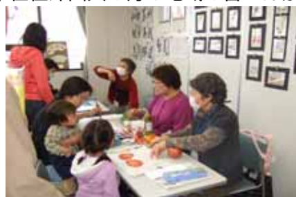
体験コーナーはどこも人気。写真は習字・絵手紙。

またおいしい手打ちそばや街の先生のミ ニ体験講座もあり、日本の良さ、自分の 住む街の良さというものを再確認できる 場でもありました。グローバル化が進む 中、皆が共生していくヒントがたくさん 詰まった素敵なイベントでした。