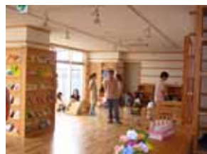
はぐはぐの樹交流スペース 入り口(左)と中の様子