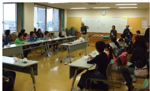
会場風景(上大岡コミュニティハウス) ▲ ▼ 自作の作品で、いざ競争