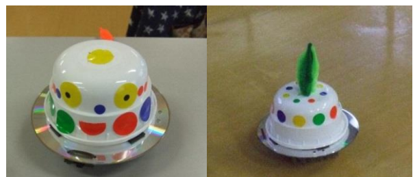
生徒作品 「おそうじロボ・サンバ」

子供たちの理科離れが、顕在化して久しい昨今ですが、私たちの活動を通じて、もっと、もっと理科好き、工作好きの子供たちが、巷にあふれるようになるといいな、と考えています。さらにその子供たちが親になり、我が子に教えて、・・・と、続くこと。“技術立国・日本、フォーエバー”を、願っています。