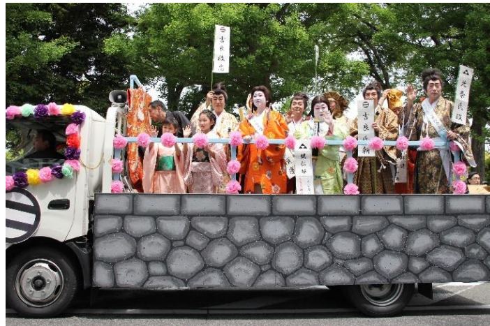
(写真は、城に見立てたトラックで移動するメンバー)

一風変わった仮装も手伝い、沿道の声援も大きかったように思えます。かつて、パレードのゴールは蒔田公園だったので、この団体の参加は必然だったのかも知れませんが、南区の歴史というと、弘明寺や吉田新田がよく知られていますが、これからは蒔田にも注目です。