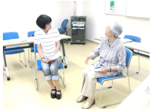
相手の身になって真摯にお話を聴きます

＜連絡先＞ 南区社会福祉協議会ボランティアセンター TEL 045-260-2510