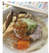
タイラーメン「クワイティアオ」。具材も味もいろいろ

みなさんはタイ料理、辛いと思いますか？私はこの辛い味が好きです。元気が出ますヨ！