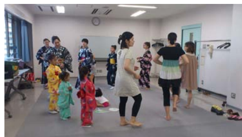
第1次活动时穿着日本浴衣跳盂盆舞的情景