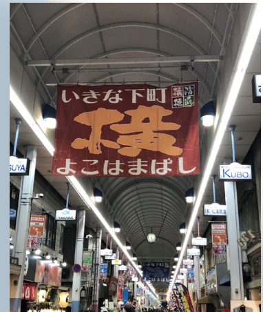
横浜桥通商店街 有很多充满活力的店铺。 销售各种各样生活用品和食物！