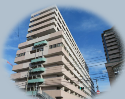
外国人服务处在浦舟複合福祉施設 (浦舟町3-46) 10楼。