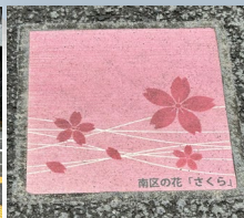
樱花图案的地砖 从阪東橋到南区役所 的路段，推荐边走边数 地砖。