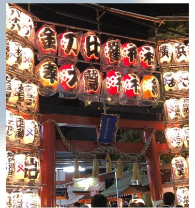
金刀比罗大鷲神社 位于横浜桥通商店街附近的神社。 西市期间有很多人前来游玩。