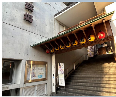
三吉演艺场 可以看大众戏剧！