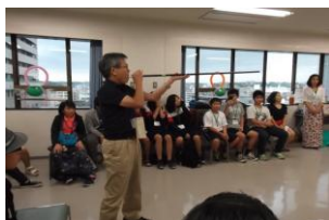
日本传统体育「吹き矢」表演，百发百中