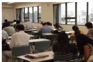
一对一的学习指导