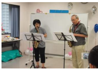
工作人员和志愿者共同演奏迪斯尼名曲