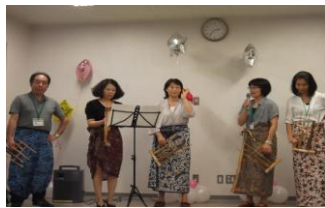
工作人员用印尼竹制乐器进行的表演