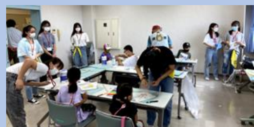
Volunteer Activity ng 2021