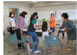
Maglaro ng paper balloon