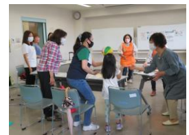
การเล่นลูกไปกระดาศ