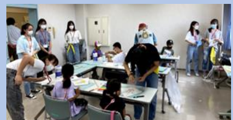
รูปกิจกรรมอาสาสมัครในปี 2021