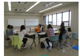
การอ่านหนังสือจากภาพ