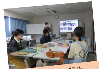
มีการฟังคำบรรยายจากรุ่นพี่ที่เป็นนักศึกษาปริญญาโท