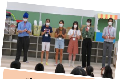
การแนะนำตัวต่อหน้าเด็ก ๆ

เมื่อหน้าร้อนที่ผ่านมาได้มีนักเรียนมัธยมปลาย เป็นต้น จำนวน 10 คน เข้าร่วมโครงการอาสาสมัครเยาวชนนานาชาติที่จัดขึ้นทั้งหมด 5 ครั้ง โดยมีการจัดงานสำหรับเด็ก ณ สโมสรเด็กประถมหลังเลิกเรียนของโรงเรียนประถมมินามิโยชิเดะ ซึ่งเริ่มจากการประชุมในเทค กล่าวรายละเอียดของงาน การจัดเตรียม การให้เด็ก ๆ ได้ลงมือทำกันจริง ๆ อย่างสนุกสนาน โดยเด็กมัธยมปลายต่างบอกว่า "กิจกรรมครั้งนี้สนุกมาก ๆ หากครั้งหน้ามีจัดกิจกรรมก็อยากจะทำอีก ครั้ง"