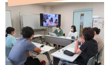
ในตอนท้าย ทุกคนได้พุดคุยกันอย่างสนุกสนานเกี่ยวกับหัวข้อ/สิ่งที่ได้เรียนรู้ และความฝันในอนาคต