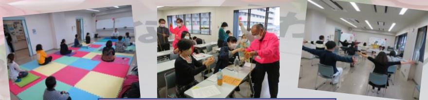
งานเวิร์คชอป

เมื่อวันอาทิตย์ที่ 20 พฤศจิกายน ได้มีการเวิร์คชอปจากเหล่าคุณครูท้องถิ่น กลุ่มกิจกรรมอาสาสมัครต่างชาติ โดยมีผู้สนใจเข้าร่วมมากมาย จึงทำให้บรรยากาศมีความครึกครื้นและเต็มไปด้วยความสนุกสนาน