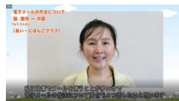
Pagtatalumpati sa Nihongo