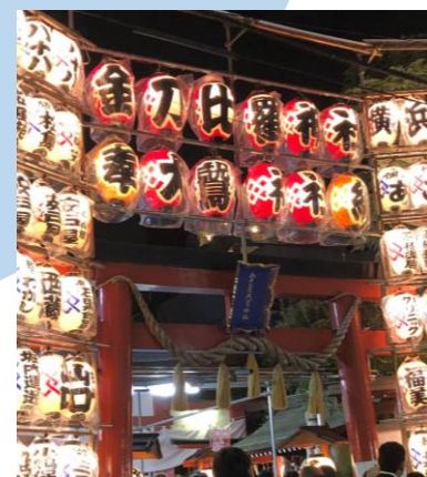
Kotohira-Otori Shrine Isang Shrine malapit sa Yokohamabashidori District .Maraming tao ang bumibisita dito sa araw ng Tori-no-ichi.