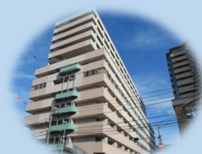
Ang Minami Lounge ay nasa 10 th Floor ng Urafune Fukugo Fukushi Shisetsu Building (Urafune-cho 3-46)