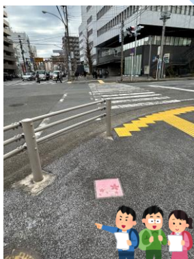
Cherry Blossom Drawn Tiles Ang mga tiles na may design ng Cherry Blossom ay nakalagay sa daan papuntang Minami Ward City Hall galing Bandobashi station. Bilangin ang dami ng tiles habang naglalakad.