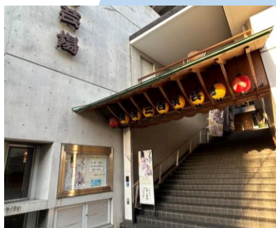
Miyoshi Engeijo Makakapanood ka dito ng Taishu Engeki (Japanese Style Performance)!