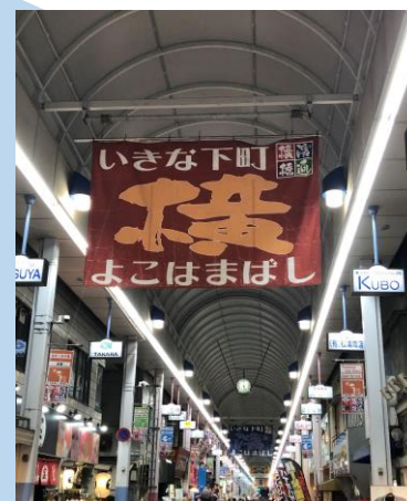
Yokohamabashidori Shopping District Maraming mga tindahan dito. Makakabili ka ng sari-saring pangangailangan mo at masasarap na pagkain!