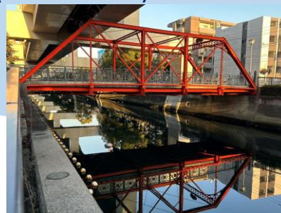
Urafune Suido Bashi Ang makasaysayang tulay sa Nakamura River