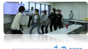
ภาพการอบรมเมื่อปี 2022