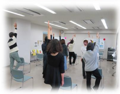
(ภาพบรรยากาศงานมินนะโนะ “วะ” เฟสต้าในครั้ง