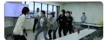
Ang mga ritrato ay kuha sa seminar noong 2022.