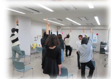
(Ang mga larawan ay galing sa nakaraang Minna no “Wa!” Festa)

Petsa: Nov.19 th (Sun.) 11:00-15:00 (15:00-15:30 Special Ukraine Stage) Lugar: Minami Citizens Activity & Multicultural Lounge