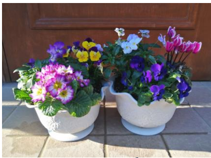
การจัดดอกไม้ใส่กระถาง