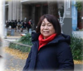
คุณสะระระ ระตี