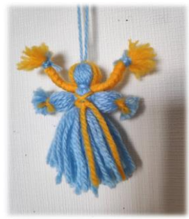
เครื่องรางจากยูเครน