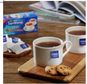
ดื่มน้ำชาและของทานเล่นจากประเทศอินโดนีเซีย