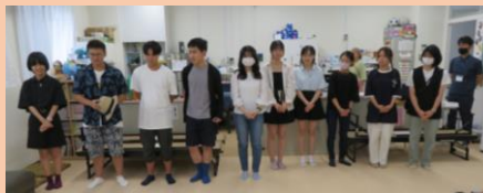
Volunteers introducing themselves

Interesado ka ba sa Minami Lounge summer volunteer program para sa mga batang mag-aaral. Maaari itong maging hindi makakalimutan na summer para sa iyo. Tuturuan namin kayo ng mga tips sa pagvolunteer at sa huli mararanasan nyo ang aktuwal na pagvolunteer sa elementary afterschool kids club. Ang programang ito ay kurso na 5 beses lamang at suportado ng Minami Lounge.