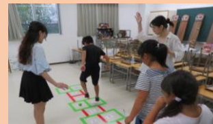
Children playing at the event (2 pic. from 2023)