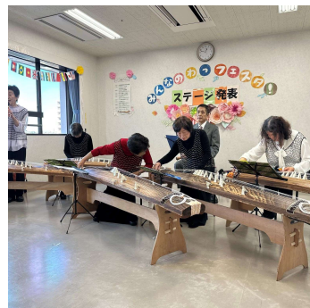
きよねんのようす