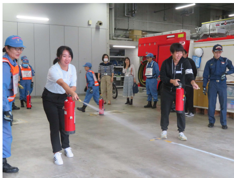
การอบรมอุปกรณ์ดับเพลิง