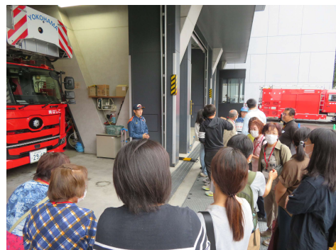
การเดินชมรถดับเพลิง