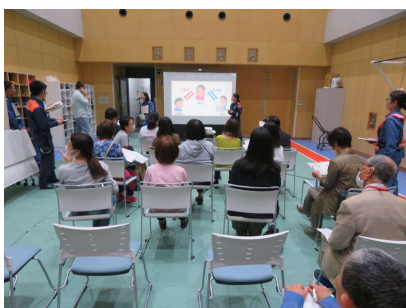
การอบรมการให้บริการโดยภาษาต่าง ๆ ผ่านทางเบอร์ 119 โดย “ล่ามพร้อมแปลสามทาง”

เมื่อวันอาทิตย์ที่ 27 ตุลาคมที่ผ่านมา ถือเป็นครั้งแรกที่ทางมินามิแลนจ์และศูนย์ดับเพลิงเขตมินามิได้ร่วมกันจัด “โปรแกรมความร่วมมือ-อบรมการแจ้งเหตุฉุกเฉิน โทรเบอร์ 119” ให้กับนักเรียนชาวต่างชาติที่กำลังเรียนในห้องเรียนภาษาญี่ปุ่น ในวันนั้นมีผู้เข้าร่วมกิจกรรม ได้แก่ นักเรียนชาวต่างชาติจำนวน 8 คน และอาสาสมัครชาวญี่ปุ่นจำนวน 9 คน ซึ่งมีการอบรม เช่น วิธีการใช้บริการล่ามแปลสามทางพร้อมกันผ่านสายฉุกเฉินเบอร์ 119 และศูนย์ล่ามทางโทรศัพท์ การอบรมอุปกรณ์ดับเพลิง การเดินชมรถดับเพลิง เป็นต้น นอกจากนี้ นักเรียนชาวต่างชาติยังเล่าประสบการณ์ความประทับใจเอาไว้ว่า “การอบรมแจ้งเหตุฉุกเฉินไม่ใช่สิ่งที่จะทำได้ง่าย ๆ หลังจากนั้นก็ต้องรับมือกับเหตุการณ์ที่มีเพลิงไหม้ที่มากขึ้น ในความเป็นจริงแล้วการได้เข้าร่วมอบรมทำให้ได้รับประสบการณ์ที่ดีเลยทีเดียว” “ในครั้งนี้ได้เข้าร่วมอบรมโดยใช้ภาษาแม่ คิดว่าเวลาเกิดเหตุฉุกเฉินต่าง ๆ จะช่วยให้เราสามารถแจ้งเหตุฉุกเฉินโดยปราศจากความกังวล”