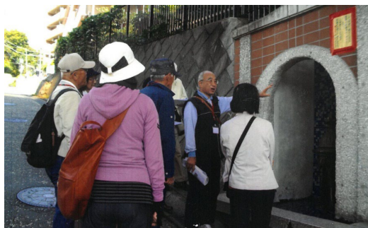
▲ 史跡を求めて、南区清水ヶ丘周辺

横浜みなみガイドボランティアの会 連絡先 電話/FAX : 045-261-7701