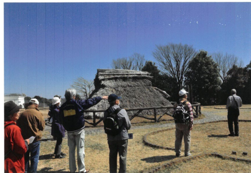
▲ 三殿台遺跡（さんとのだいいせき）

現在、ボランティアを募集しています。郷土の歴史的建造物、由緒ある神社・仏閣、下町の雰囲気に興味を持っている好奇心のある方、一緒に活動してみませんか。仲間同士でガイドのスキルアップを心がけながら「参加して良かった。次も参加しよう」と参加者に満足していただけるように心がけながら活動しています。