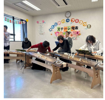
Last year's Minna no "Wa!" Festa