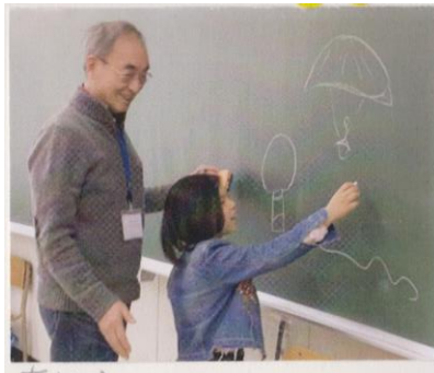
รูปภาพในขณะที่ทำอาสาสมัครภาษาแม่

"คุณครู! ยังจำผมได้ไหมครับ" เสียงดังมาจากสนามของโรงเรียน ซึ่งเป็นเสียงของเด็กผู้ชายที่ผมเคยช่วยสอนภาษาอังกฤษ โดยผมได้นั่งข้างเขาในห้องเรียนเมื่อ 3 ก่อน ซึ่งตอนนี้ก็เข้า ป. 5 แล้ว ผมคิดว่า เขาน่าจะมีเพื่อนต่างชาติมากมาย และนักเรียนทั้งชั้นก็ดูสดใสว่าเรื่องอย่างมาเลยครับ