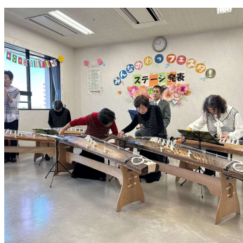
ภาพบรรยากาศของปีที่แล้ว

การแลกเปลี่ยนข้อมูลสำหรับคุณแม่และคุณพ่อชาวต่างชาติ : 「วิธีการสมัครเข้าโรงเรียนเตรียมอนุบาลและโรงเรียนอนุบาล」 รายละเอียดดังนี้ !